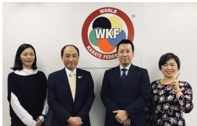
上：新国立競技場。一日、一日建設が進む様子に東京2020へのカウントダウンを実感します。 下：WKF事務総長事務所スタッフより新年のご挨拶を申し上げます。

したことが記憶に新しいですが、今回も、とくにJKF会員、関係者の皆様にご協力いただかねばならない場面が必ず訪れます。ご理解とご助力を賜りたく、よろしくお願いいたします。